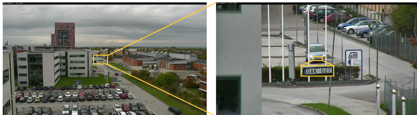
Модель AXIS Q6045-E с разрешением HDTV 1080p позволяет рассмотреть номерной знак автомобиля на расстоянии 275 м. Слева приведен широкоформатный снимок, а справа – 20-кратный оптический зум.