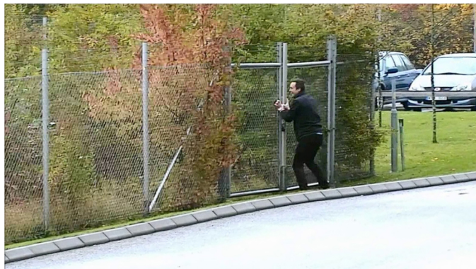
Зум и вибрация: слева приведено изображение с камеры при отключенной EIS, справа — с AXIS Q6044-E при включенной стабилизации в ветреную погоду.