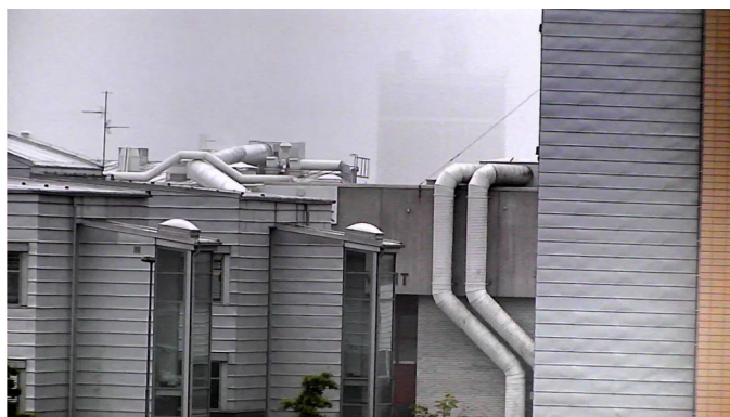
Изображения с камеры AXIS Q6044-E: снимок слева получен при отключенном противотуманном фильтре, справа — при включенном.